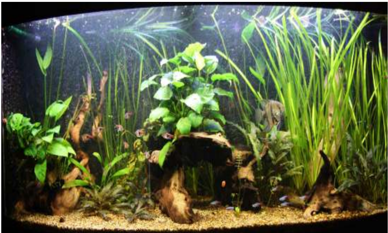
Aquarium van Martin Scheepstra Nr. 8 – 367 punten, 58,5 biologisch - poedelprijs