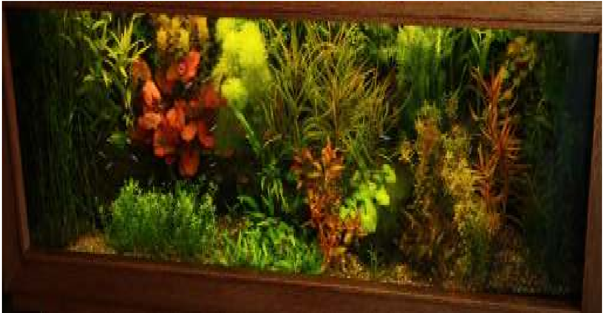
Aquarium van Henk Scholte Nr. 1 – Wisselbeker - 392 punten, 62,5 biologisch