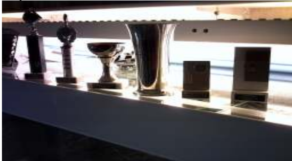
Gewonnen bij huiskeuringen.

niet, maar ik zet ze brutaal even op zijn lege bak om een foto te nemen. Per slot van rekening tonen ze toch duidelijk aan dat hij wel “iets” van aquaria afweet.