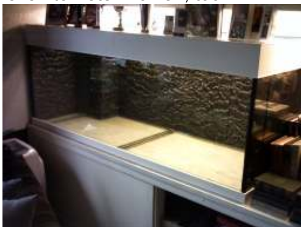
1.60x55x55 - Leeg maar niet lang meer?

Om maar met de deur in huis te vallen, in de huiskamer staat een mooi afgewerkte bak met witte boven- en onderrand. 1.60x55x55. De verlichting is uit. Dat zal wel een reden hebben. Misschien een dagelijkse lichtpauze voor een betere plantengroei? Ik gluur door de voorruit, geen planten, geen vissen, geen bodembedekker, de bak is...léég! Ik hoor mezelf giechelen en ga gauw op de bank zitten, terwijl Jaap een kopje koffie voor me maakt. Ik begin wat vragen op hem af te vuren. Lege bak of niet, we willen iets over Jaap's leven te weten komen, toch?