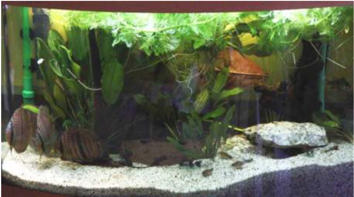
Aquarium van Mario Roelvink Nr. 7 – 367,5 punten, 57 biologisch