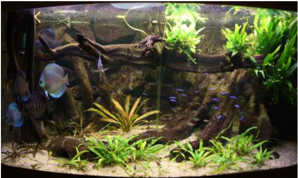
Aquarium van Mario de Jong Nr. 6 – 375,5 punten, 58,5 biologisch