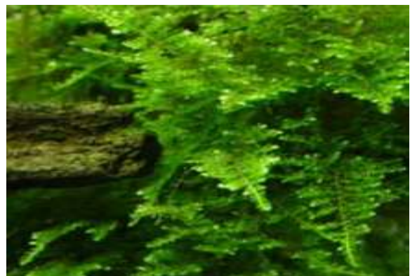
Christm asm os

Aquatiele mossen hebben we ook in eigen land: De zogenaamde Kribbenmossen. Maar ook uit Zd. Amerika is er eentje in de liefhebberij opgedoken: het Xmasmos zoals het voorlopig genoemd wordt.