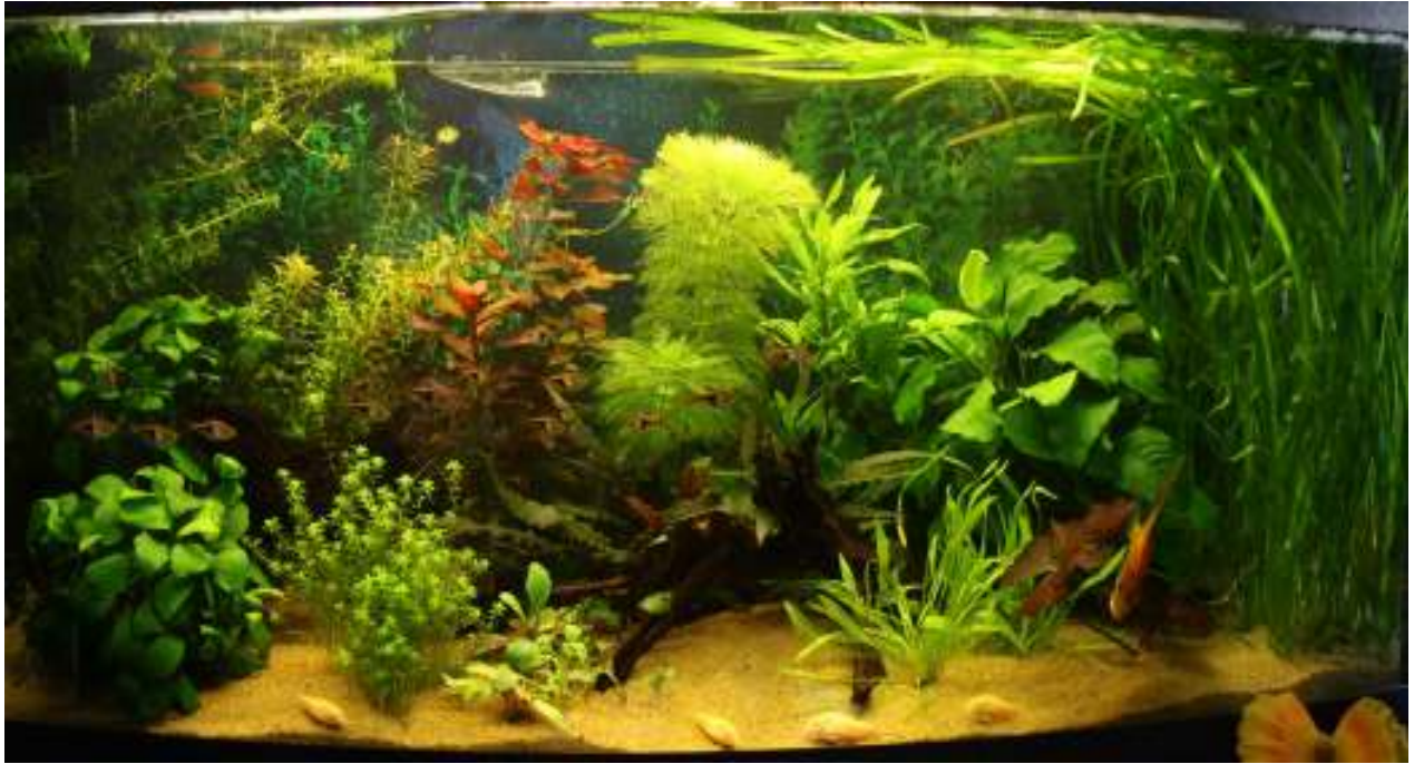
Aquarium van Wil Hille Nr. 3 – 378,5 punten, 59,5 biologisch