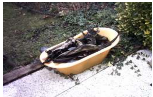
Kienhout ligt al maanden te wachten....