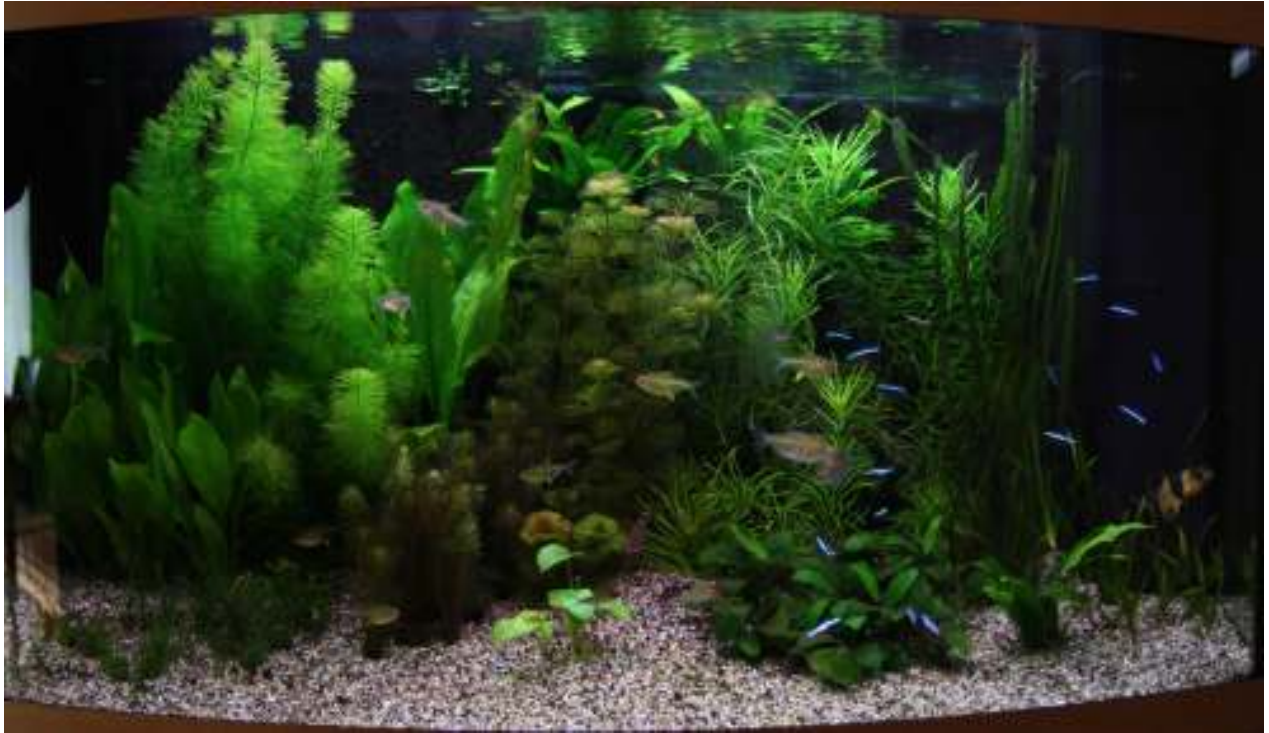
Aquarium van Cor van Mil Nr. 5 – 376 punten, 59 biologisch