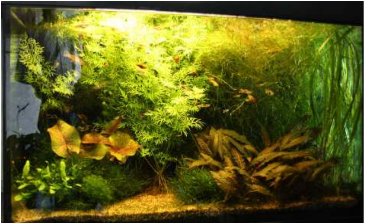
Aquarium van Nico Zonneveld Nr. 4 – 378 punten, 60 biologisch