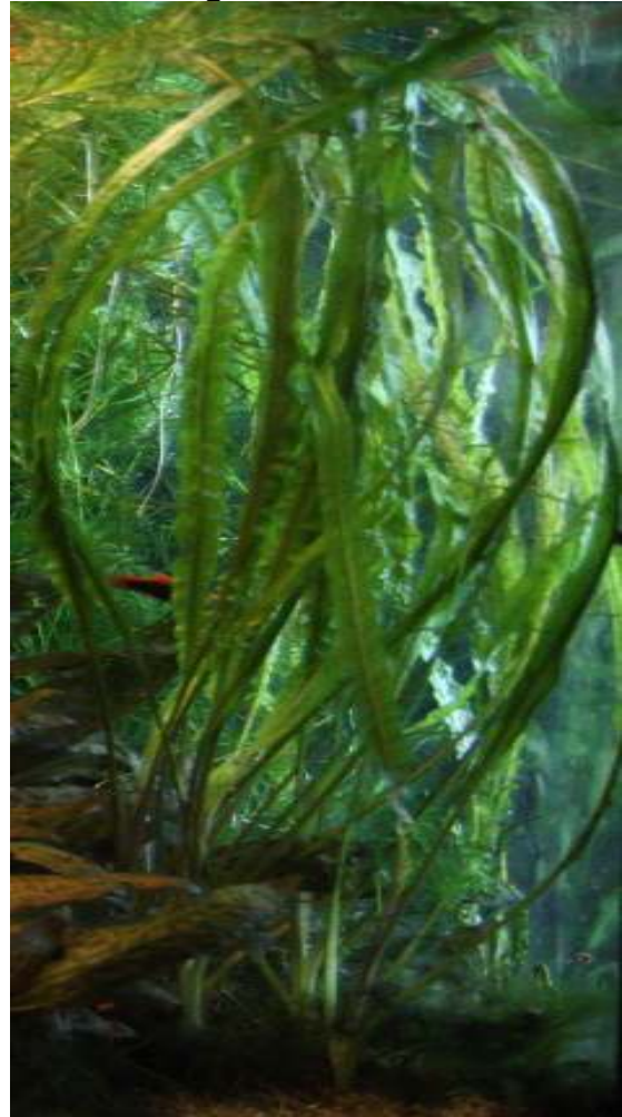
Cryptocoryne crispatula var. balansae

wel regenwater. Dit moet wel schoon zijn. Ik laat het altijd een poosje flink doorregenen voor ik het opvang voor het aquarium of de kamerplanten. Je kunt nu met een veel lager CO 2 -gehalte in de bak toe en de vissen reageren daar op met een rustige ademhaling.